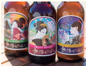
浪漫(ペールエール)/爐(ビルスナー)/雅(レッドエール)