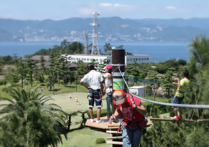
樹の上を渡りながら21のアクティビティに挑む「SARUTOBI」。ヨーロッパでも人気です。