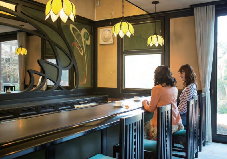
歴史の風格深う「起雲閣」の庭園を眺めながら、熱海の恵みを味わって。