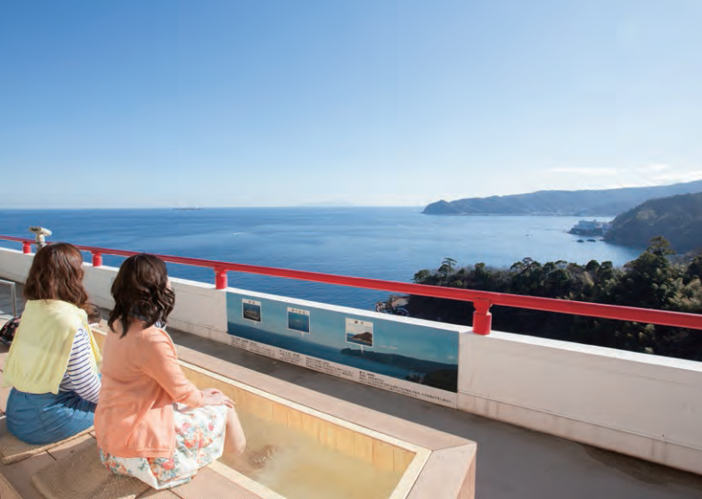
ジェット足湯に入りながら海の眺望を楽しめる、おもてなし満載の熱海城です。