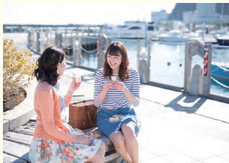
◎熱海市渚町(米川沿いから親水公園周辺)

旅館や土産物屋が立ち並びいわゆる温泉街とは異なり、街のどこどころに生活の薫りが漂う熱海。店と店がひしめき合う細い路地をすり抜けると、目の前に広がる海の景色——海に向かっていくつもの細い路地がのびる渚町では、こんなうれしい偶然に出会えます。 目貫き通りの銀座商店街も一本裏道に入れば、スナックやバーが立ち並び夜の情緒が漂います。路地を制覇したら熱海ツウ。偶然の出会いを求めてふらりと路地を歩いてみては。