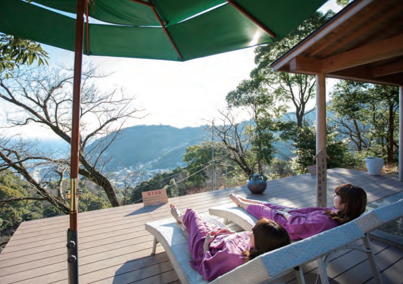
豊かな森と眼下に広がる海。非日常の空間に、心も体もリラックス。