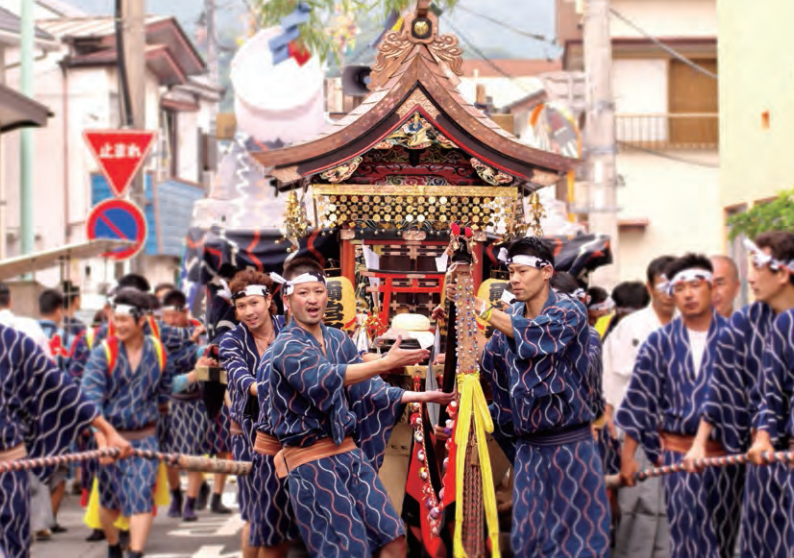
最終日には網代ベイフェスティバルを開催。太鼓の心地よいリズムに身を委ねて。