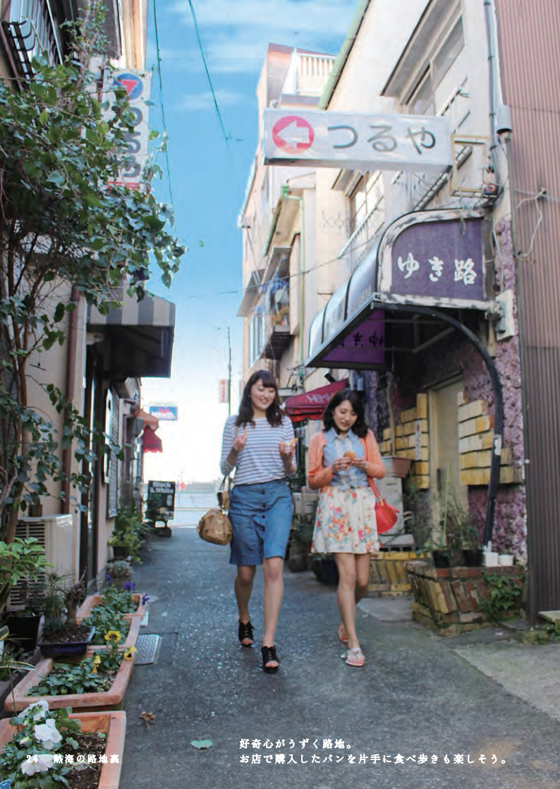
◎熱海市銀座町(銀座商店街から初川沿い)