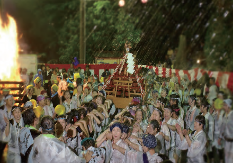
「大声を出して、ストレス発散できます」と参加者から好評の神輿体験ツアー