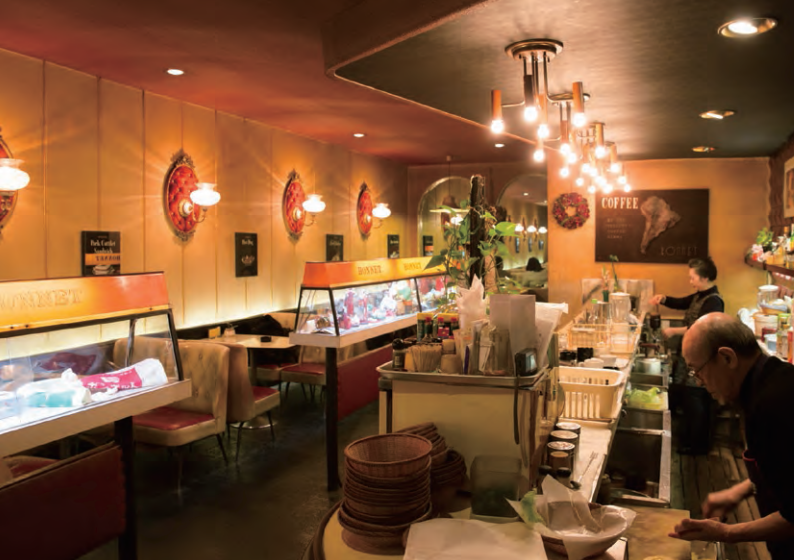
昭和の趣と共に、当時の最先端のメニューやサービスに触られます。