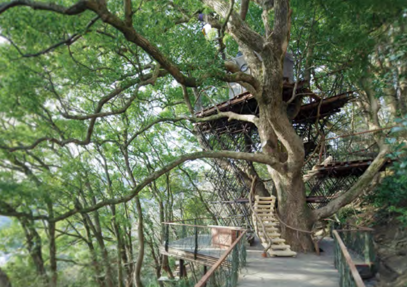
御神木からツリーハウスまで、熱海ではクスノキのさまざまな表情に出会えます。