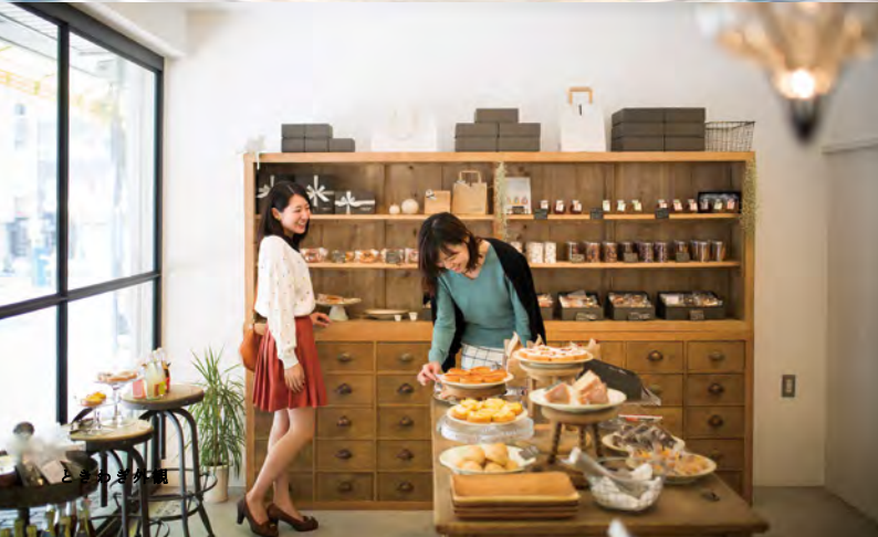
上／格式高い格天井など伝統的な建築美が光る「ときわぎ」。 下／アンティーク家具がレトロで温かい雰囲気を出す「KASHI.KICHI」。