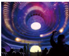
プロジェクションマッピング「SPACE ECHO」MOA美術館 11/20~26