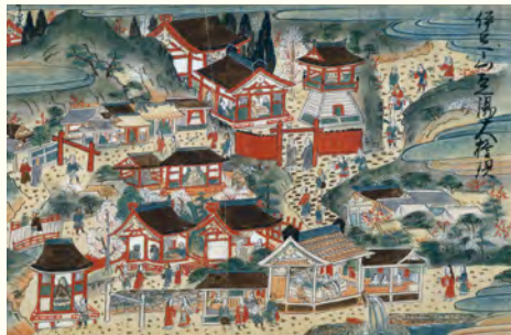
伊豆山温泉が描かれた「箱根権現景起絵巻」(部分) 個人蔵

伊豆のお湯の発祥の地・伊豆山神社。伊豆山の地下では神の化身「赤白二龍」が温泉を生み出しているという言い伝えがあり、ふもとの「走り湯」は神湯として信仰されてきました。その昔、人々は走り湯の潔斎所にて身を清めてから参拝していたそうです。強運の神として知られる「赤白二龍」の姿は、境内の手水、社殿、お守りにも施されています。昔も今も人々を温め、見守り続けるお湯の原点です。