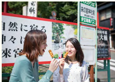
店名に「パン」がつくのには和菓子売っているお店「米の宮健康パン」。名物は「みたらし団子」110円。米宮神社の参拝の帰りに立ち寄って。