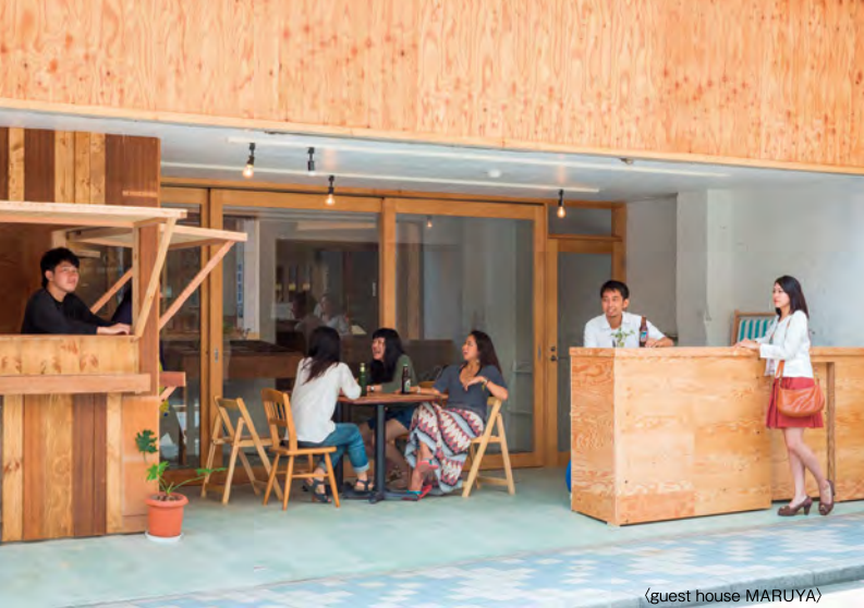
(guest house MARUYA)