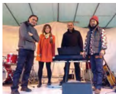
Autumn Leaves in Jazz 熱海梅園中央広場 11/15、22、23、29、12/6