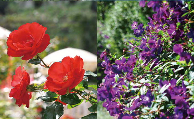
上／世界有数のジオポイント・鐘ヶ浦では、伊豆半島の原風景が見られます。 下／「アカオハープ&ローズガーデン」では、秋冬も美しい花が楽しめます。