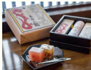
常盤木羊羹店の「赤白二龍」1800円。