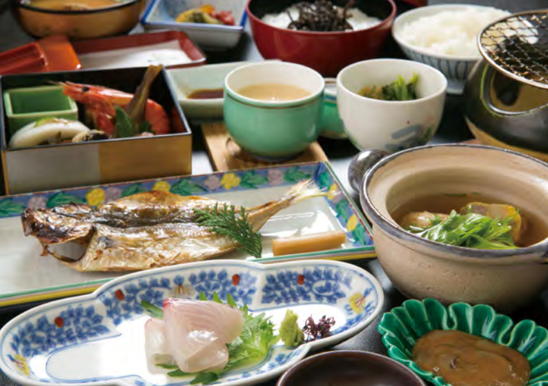
朝食としても、グルメなお土産としても、さまざまな楽しみ方ができる干物。