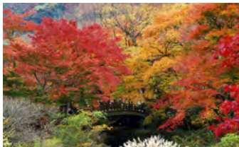
熱海梅園もみじまつり 熱海梅園 11/14~12/6