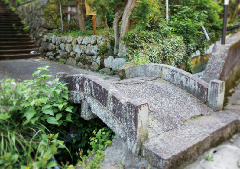
ロマンチックな恋の言い伝えが息づく伊豆山神社。伝説の逢初橋で“出逢い運”アップ！