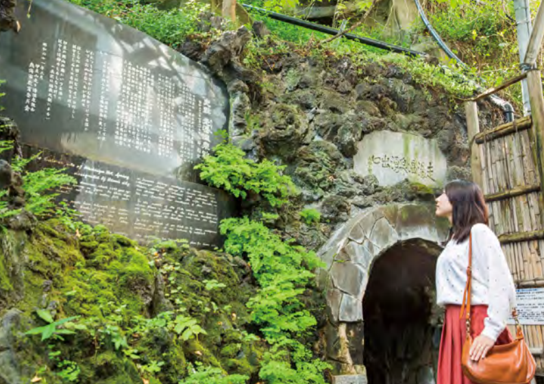
横穴式の源泉「走り湯」は全国的にも珍しい史跡です。