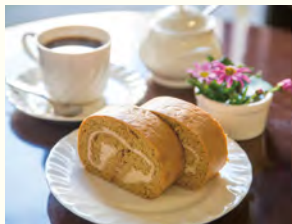
谷崎が好んで食べた「MONT BLANC」のモカロール