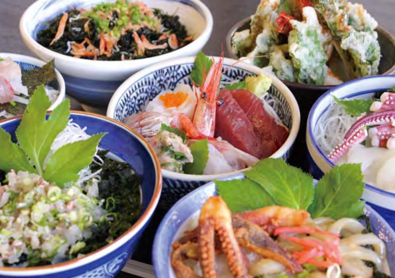
朝どれの新鮮な魚介類や、伊豆名産の野菜・アシタバなどを使ったオリジナル井を満喫。